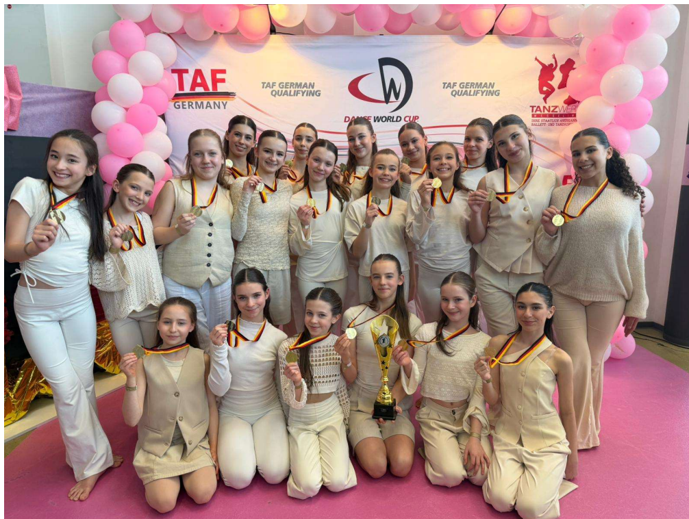
TSC Dortmund, Kids Large Group Contemporary "Re: Life – unsendable"